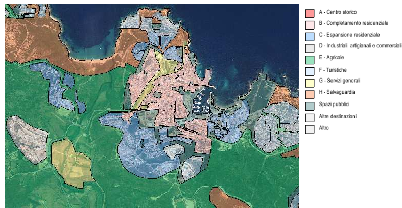
STRUMENTO URBANISTICO VIGENTE – PUC del 2002

Nel PUC del comune di PALAU non è presente la zona A. Il Comune di PALAU non è dotato di Piano Particolareggiato.