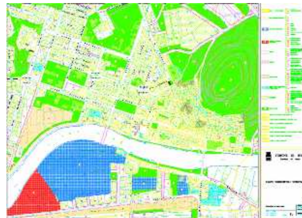
STRUMENTO URBANISTICO VIGENTE – PUC del 2006

Nel PUC del comune di Bosa è presente la zona A. Il Comune di Bosa è dotato di Piano Particolareggiato, approvato con Decreto Assessoriale n°1524/U del 21/12/1989