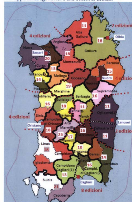
All. 3 - Ripartizione dei Comuni per edizione sulla base dell'appartenza agli A.T.O. e alle Unioni di Comuni