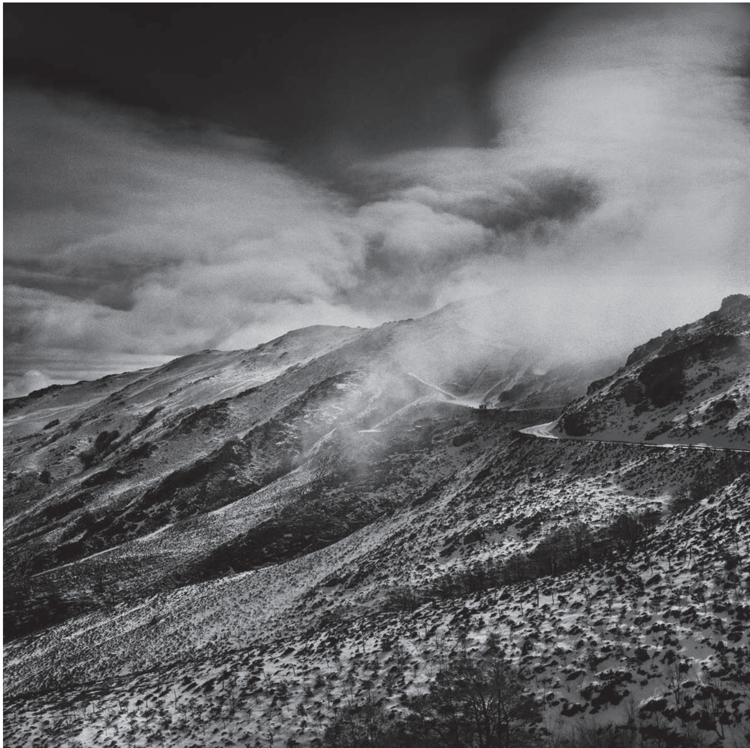
Il Passo Bruncuspina nel cuore del Monte Gennargentu durante una tempesta di neve