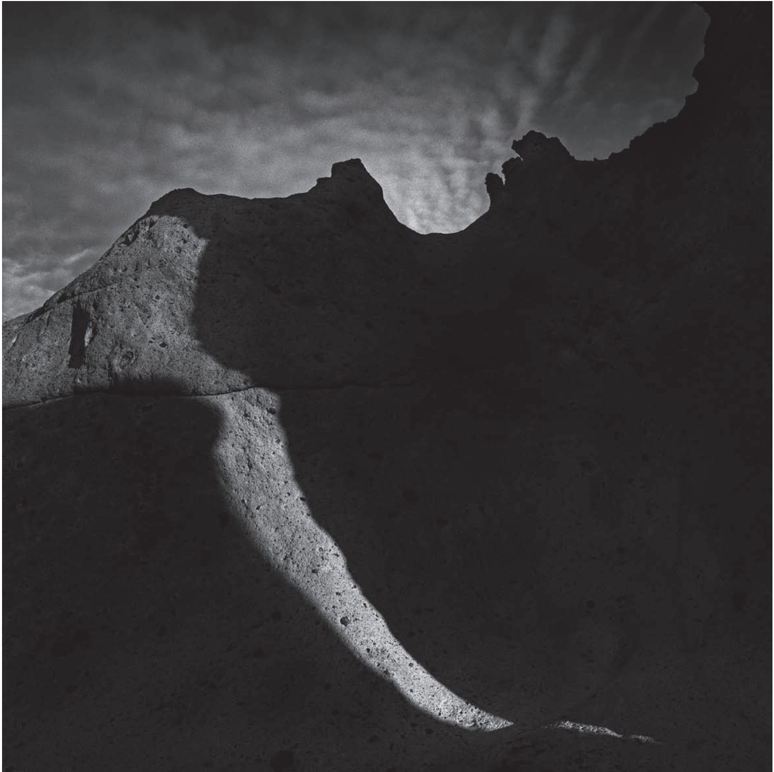
Giochi di luce ed ombre sulle scogliere nei dintorni di Bosa