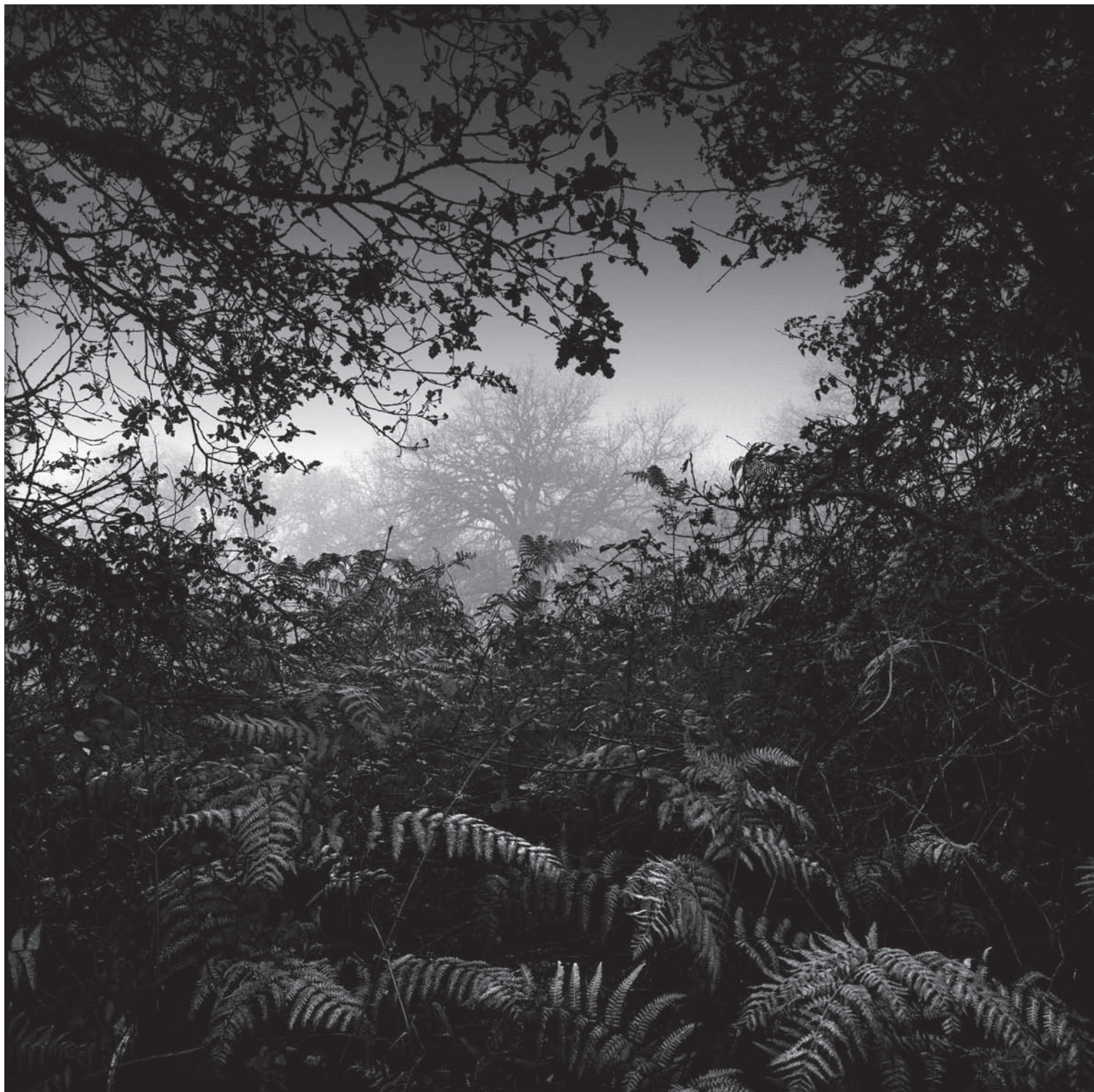
Giornata nebbiosa in un bosco della Barbagia Ollollai